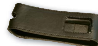
Svart läderfodral med fönster Varunr: 203055