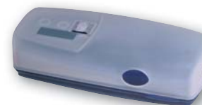
Hårt plastfodral Varunr: 203054