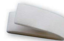
Elastiskt midjebälte (Vitt) Varunr: 201474