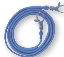
Nackrem (Blå) Varunr: 201476