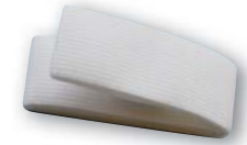
Elastiskt midjebälte (Vitt)