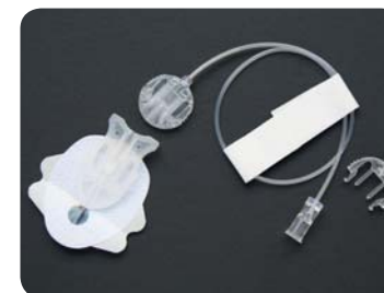
Comfort™ Short/Neria Soft