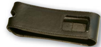
Svart läderfodral med fönster